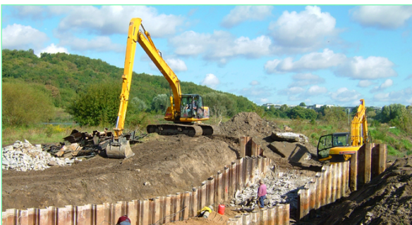
Rückbau von Querbauwerken