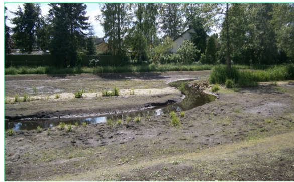
Reaktivierung von Flussauen

Mitglied der Güteschutzgemeinschaft Kanalbau, im Bund der Ingenieure für Wasserwirtschaft, Abfallwirtschaft und Kulturbau (BWK), der Baukammer Berlin und eingetragen in das Amtliche Unternehmer- und Lieferantenverzeichnis (ULV) des Landes Berlin, seit 2002 Ausbildungsbetrieb.