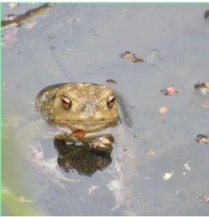
Recherche und Erfassung